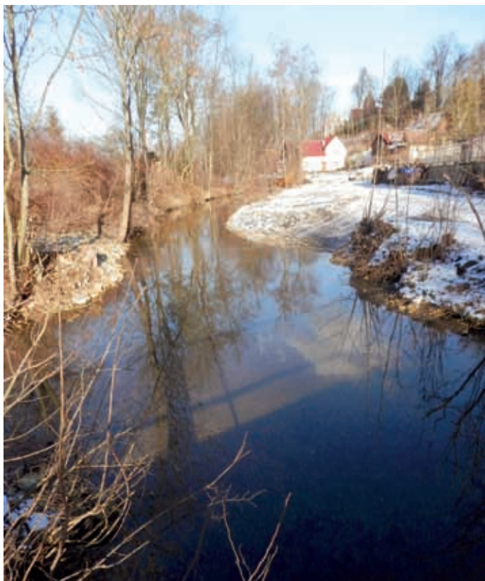
Upravené koryto Desné po překopu u Novákových