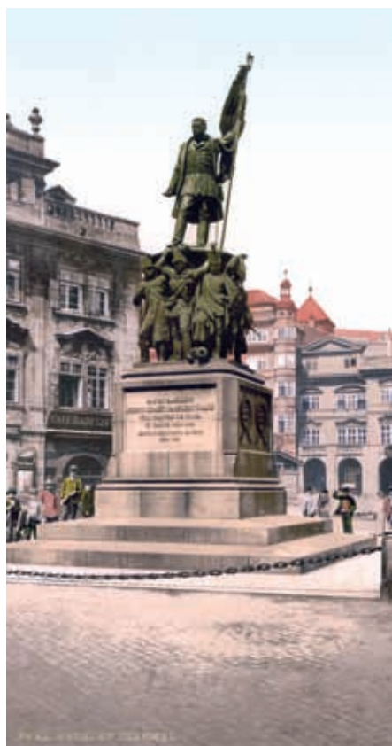
Pomník slavnému českému vojevůdci, hraběti Radeckému (foto asi z r. 1900). V roce 1920 odstraněn, nyní se jedná o jeho obnovení.