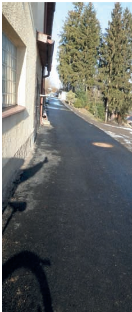
Jedna z nových cest po Osiku