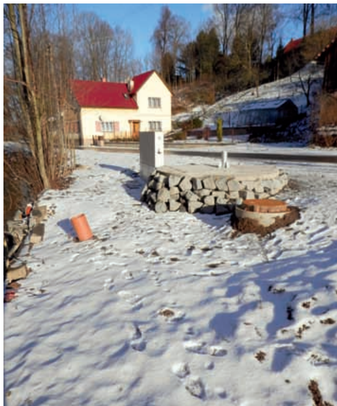
Čerpací šachta č. 2 u Marčíkových