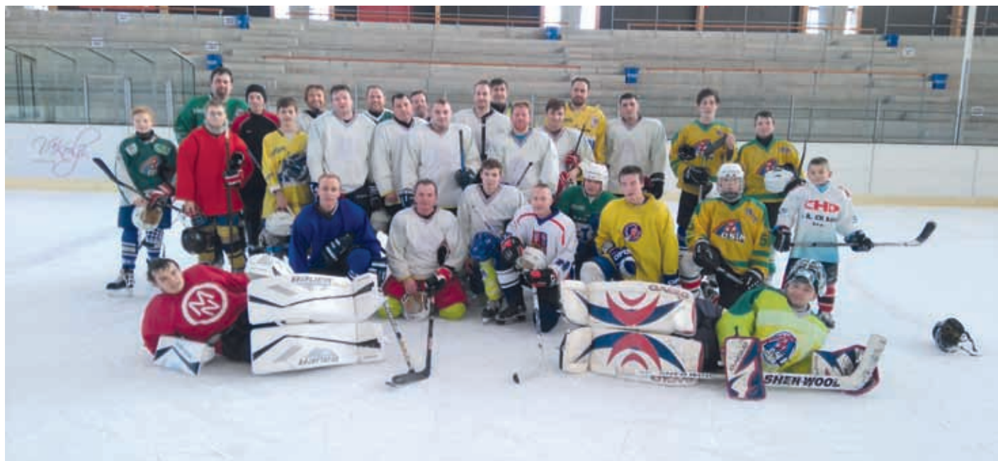
Foto ze silvestrovského randamače, o kterém se nic nedočteme